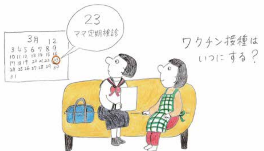
イラストレーション: 塚直子

HPVワクチン接種の有無にかかわらず、20歳を過ぎたら2年に1回、子宮頸がん検診を受けましょう。ほとんどの自治体で費用の補助を行っています。なお、子宮頸がんについてわからないことがあるときは薬局の薬剤師に気軽にご相談ください。